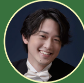
ごとう こう 後藤康 ヴァイオリン NHK交響楽団