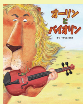
作:すみもとなみ/出版社: (株)イマジネーション・プラス

年老いたライオンのオーリンは、荒原でバイオリンを拾います。バイオリンの中から飛び出してきたキリギリスとの出会いで、オーリンは音楽に魅了されます。一生懸命バイオリンを練習するオーリン。いつしかその音色に動物たちが集まり、やがて。音楽を通して生命の力強さを感じられる絵本です。