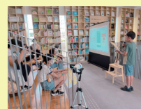
(左)小学生ビブリオバトル・ワークショップの様子 (右)読書バリアフリー体験セット内容