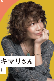
パネリスト ヤマザキマリさん (漫画家・文筆家)