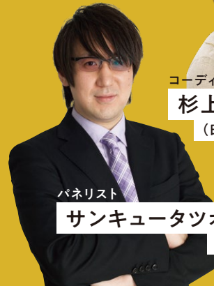
パネリスト サンキュータツオさん (学者芸人)