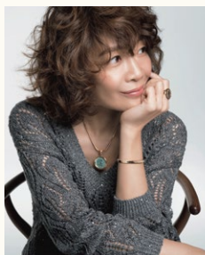
パネリスト ヤマザキマリさん (漫画家・文筆家)

1936年栃木県生まれ。1979年『ガン回廊の朝』で第1回講談社ノンフィクション賞、95年ノンフィクション・ジャンルの確立への貢献で第43回菊池寛賞など、受賞多数。災害・事故・公害問題や、生と死、言葉と心の危機、子どもの心の発達と絵本の重要性についてのメッセージを発信し続けている。著書に『生きる力、絵本の力』、『言葉が立ち上がる時』、『言葉の力、生きる力』、翻訳絵本に『ヤクーバとライオン』、『少年の木』、『その手に1本の苗木を』、『だじょうぶだよ、ゾウさん』など多数。