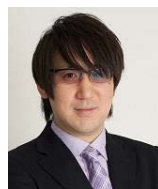
学者芸人 サンキュータツオ氏