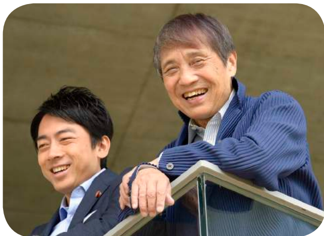
小泉進次郎さんと安藤忠雄さん 絵本美術館「まどのそのそのまたむこう」（福島県いわき市）にて

ところ：大阪市中央公会堂 〒530-0005 大阪市北区中之島1丁目1番27号 http://osaka-chuokokaido.jp/